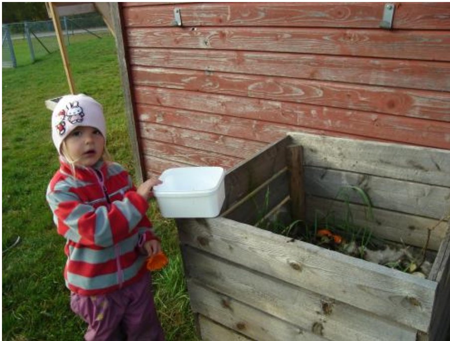
nu har jag slängt i våra skal.