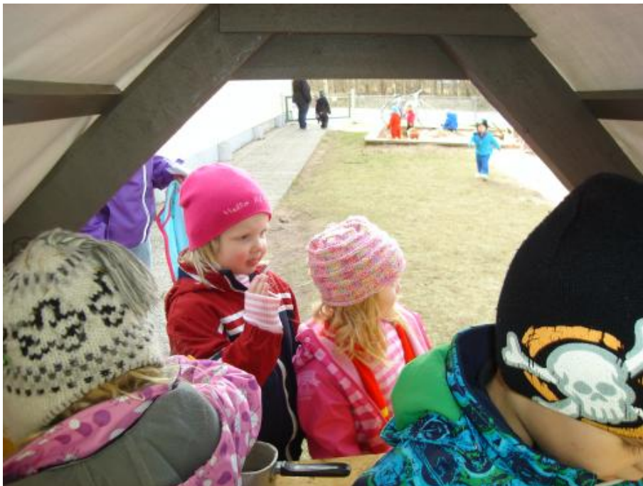
Nu är det min tur att handla.

Mål 5: Ge barnen möjlighet att genom upplevelse kunna uttrycka sig i ord om vad som är vackert och vad som är fult.