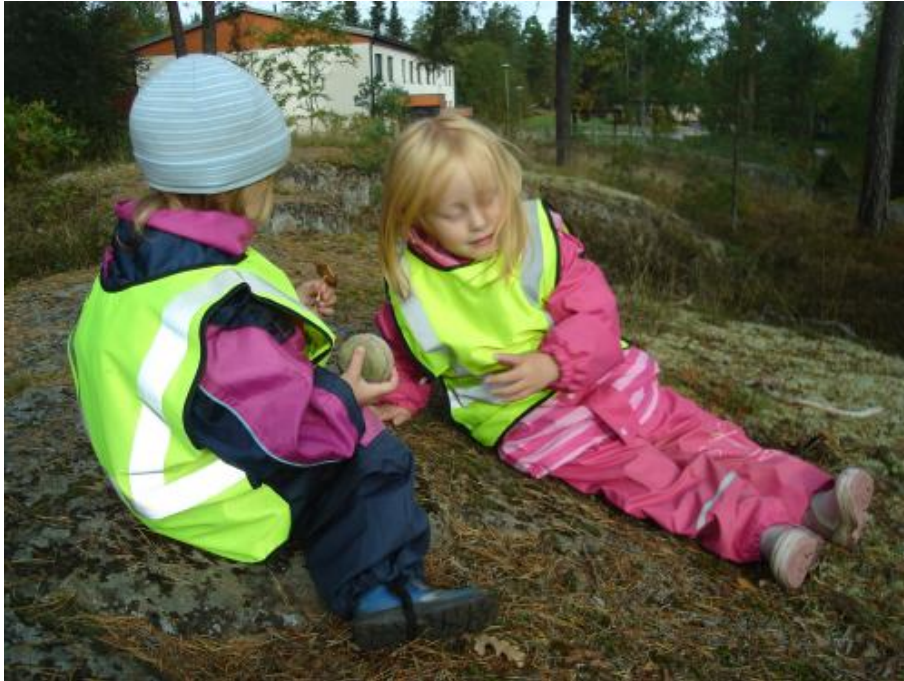
En liten pratstund på berget