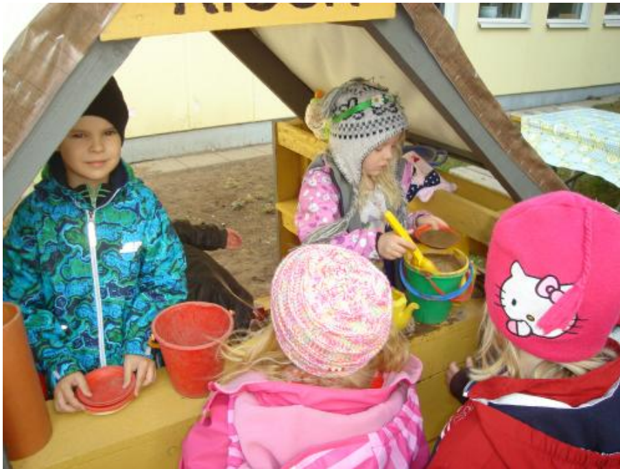
Kiosken, den är populär.