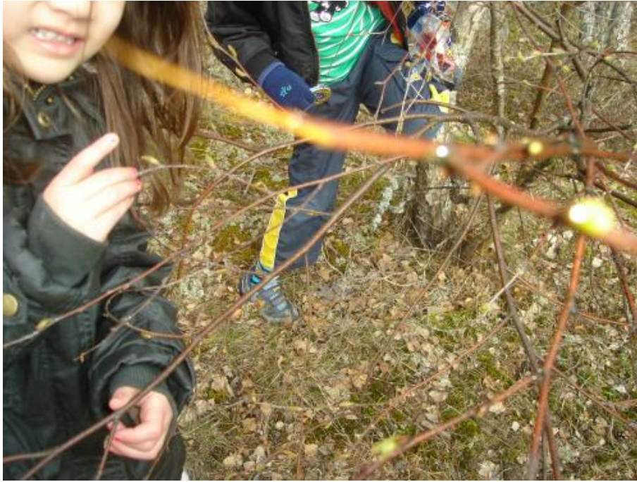
Vem har brutit av en gren från trädet?