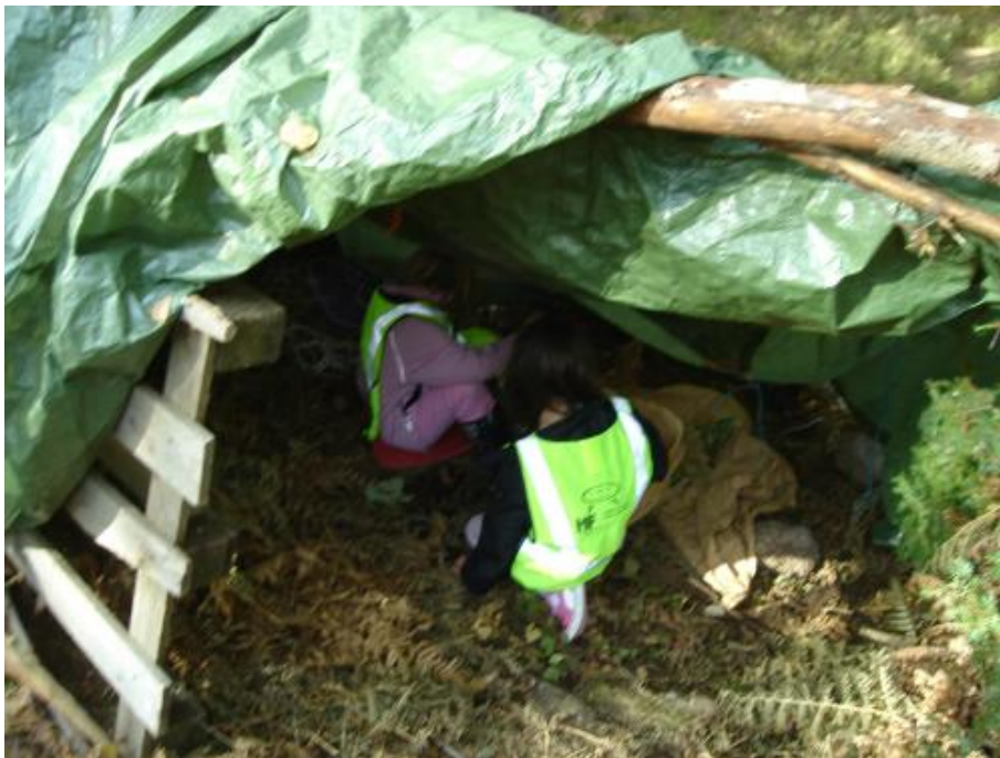
Hur ser det ut inne i kovan?

Mål 2: Alla barn ska ha en förståelse för vår allemansrätt.