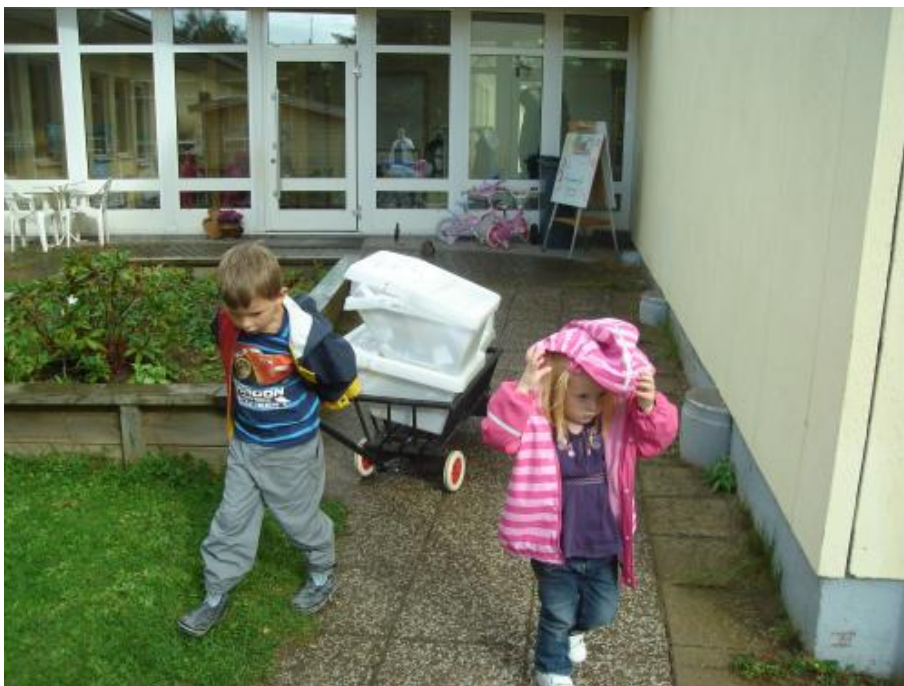
Barnen hjälps åt att köra ut vår sortera material.