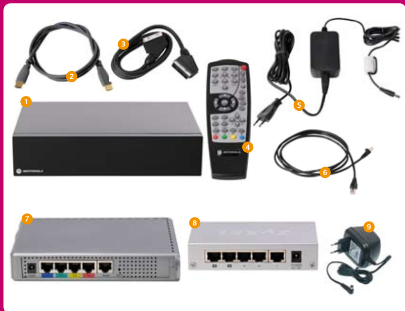
Digitalbox (1), HDMI-kabel (2), scartkabel (3), fjärrkontroll (4), strömadapter (5), nätverkskabel (6), bredbandsswitch (7), tv-switch (8), strömadapter (9).